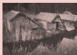
Nr 10. Tuskötäppan, Söderön, Östhammar

Här utspelade sig stora delar av filmen Midvinterduell (1983). År 2010 invigdes denna nya mjölkpall till minne av Lars Molin och inspelningen.