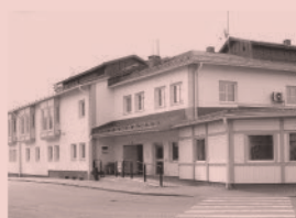
Nr 08. SKB, fd. Stadshotellet, Norra Tullportsgatan 2, Östhammar

I tv-serien Mona och Marie (1973) jobbar tonårstjejen Mona i frisörsalongen innan hon ger sig ut på resa för att lifta genom Europa.