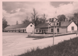
Nr 17. Forsmark, Infocentrum, väg 76, Forsmark

I filmen Midvinterduell (1983) fikar vägarbetare Bengtsson hos flickvännen på fd. Lundeborgs Konditori som var namnet då.