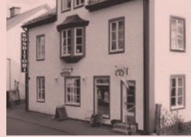
Nr 16. Kafé Wilmas, Kyrkogatan 10, Öregrund

"Röda huset" på Västergatan 9 hade en central roll i filmen Badjävlar . Huset hyrdes i filmen av familjen Blomgren som vräktes när direktören från Stockholm köpte huset.