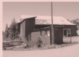
Nr 11. Tvärnö Såg Tvärnö, Östhammar

Inte långt från Långalma, på väg mot Raggarö, ligger Tuskötäppan som var med i filmen Badjävlar . Platsen är både vacker och historiskt intressant.