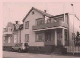
Nr 12. "Gröna huset" och hamnpromenaden, Södra hamnplan 6, Öregrund

Fortsätter man över Tusköbron, i filmen Badjävlar kallad "den skandalösa spången" kommer man till Tvärnö Såg. Där hämtade den envise bonden Egon i filmen Midvinterduell , allt sitt virke till mjölkpallarna.