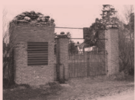
Nr 03. Fotbollsplan, Husbackavägen, Östhammar.

Sporthallen figurerar i både TV-serien Mona & Marie samt i filmen Badjävlar .