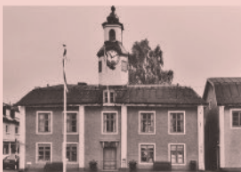
Nr 04. Rådhuset & Rådhusstorget, Rådhusgatan, Drottninggatan, Östhammar.

Mitt emot friluftsområdet Gammelhus, ligger gräsplanen som hade en betydande roll i filmen Badjävlar .