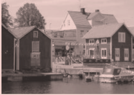
Nr 13. "Gula huset" och hamnen, Strandgatan 16, Öregrund

I filmen Sommarmord är scener inspelade i det gula huset på Strandgatan. Till vänster om sjöboden Skonaren ligger båtrampen som används i filmen.