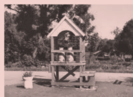
Nr 09. Mjölkpallen, Långalma, 1239, Söderön, Östhammar

Här låg tidigare Östhammars Stadshotell, där Lars Molin var en flitig gäst. Hotellet figurerar i Badjävlar (1971) och Mona och Marie (1973).