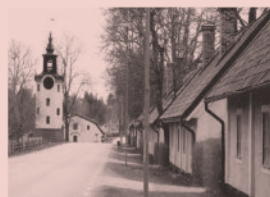
20. Bruksgatan, Hargs Bruk, stolpen/skylten med information hittar du vid Bruksgården

Platsen som figurerade i filmen Midvinterduell var även Lars Molins arbetsplats under 7 år, innan författarkarriären tog vid.