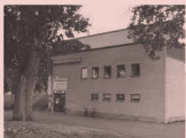
Nr 02. Frösåkershallen, Skolvägen 3 i Östhammar.