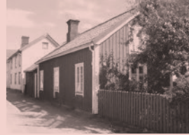
Nr 15. "Röda Huset", Västergatan 9, Öregrund

Både Strand Hotell i Öregrund och restaurang Hasselbacken, (numera rivet), figurerar i filmerna Badjävlar och Sommarmord . Stolpen/skylten med information hittar du vid metallportalen.