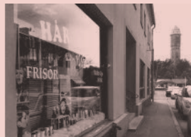
Nr 07. Damfriseringen Hårcenter, Rådhusgatan 2, Östhammar.

Här hålls den årliga Molinska Filmfestivalen varje år i november sedan 2008. Sedan 2010 står Lars Molin Sällskapet även värd för utdelandet av Lars Molinstipendiet , instiftat av Sveriges Dramatikerförbund och SVT.