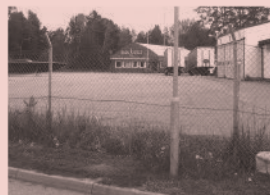
Nr 19. Skylten finner du bredvid lyktstolpen vid OK/Q8 macken