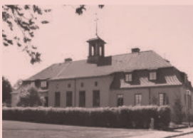
Nr 05. Församlingshem, och fd. Tingshus, Drottninggatan 17, Östhammar.

En viktig plats i filmen Badjävlar hade även Rådhuset och dess torg i Östhammar. Här sammanträdde t.ex. kommunstyrelsen.