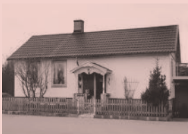
Nr 01. "Molinska villan", Hargsgatan 3 i Östhammar.