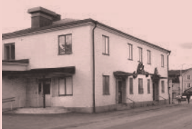
Nr 06. Biograf Storbrunn, Klockstapelsgatan 2, Östhammar.