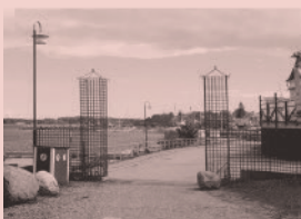
Nr 14. Strandhotellet och fd. restaurang Hasselbacken, Öregrund

"Jag behöver inte vara underhållande, jag behöver inte vara rolig, jag kan till och med vara tragisk. Men - jag får inte vara tråkig"