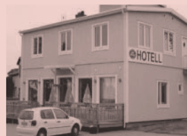
Nr 18. Gamla Järnhandeln, Norrskedika Hotell & Café, Norrskedika

På platsen där Kärnkraftverket idag ligger och vid reaktor 2, spelades scener in till filmen Bomsalva (1978).